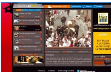
Imagen de la página inicial de Directa.tv.